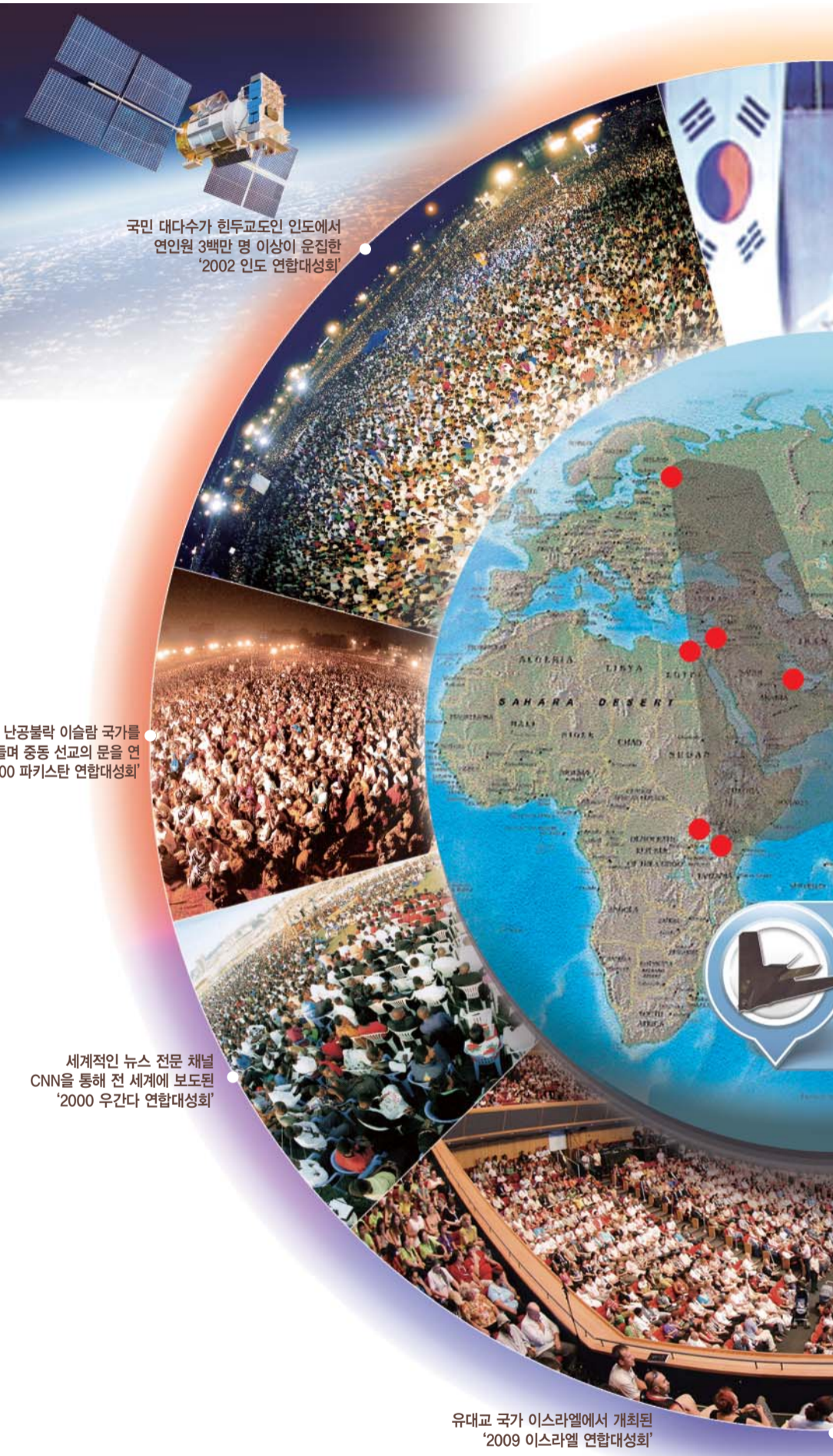
국민 대다수가 힌두교도인 인도에서 연인원 3백만 명이 넘는 '2002 인도 연합대성회'