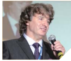
안드레 가지로우스키 홀로코스트 후원 및 이스라엘 이민지원연맹 회장