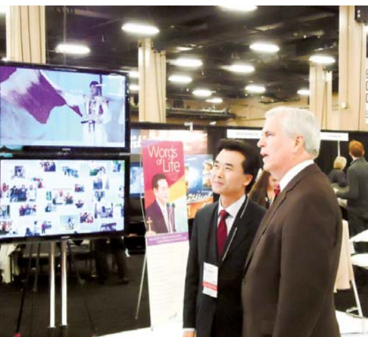
'NRB(세계기독교방송인협회) 총회 및 박람회'에 참가한 GCN 방송 부스를 방문한 프랭크 라잇 전 NRB 회장.