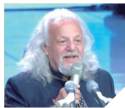
미하일 모글리스 박사 미국 영적외교단체 회장