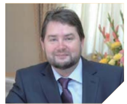
이고르 니키티ن 목사 TBN 러시아 사장