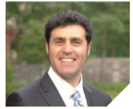
다니엘 로젠 목사 크리스탈포럼 (이스라엘목회자협의회) 대표