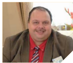
에스테반 한탈 목사 온두라스 JBN TV 사장