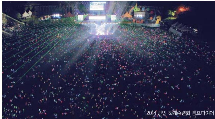
2014 만민 하계수련회 캠프파이어

2014년에는 본격적인 성령의 역사 가운데 이전보다 더 크고 놀라운 하나님 권능의 역사와 사람의 근본 마음까지 변화시키는 재창조의 역사가 베풀어지고 있다. 이를 통해 성도들의 믿음이 크게 성장하므로 수많은 성도가 믿음의 반석에 서고, 영의 사람이 되어 영의 평준화가 이루어졌으며 온 영의 사람들과 목자를 중심으로 조직이 활성화되고 있다.