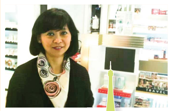
풍리주 성도 (프랑스 파리)