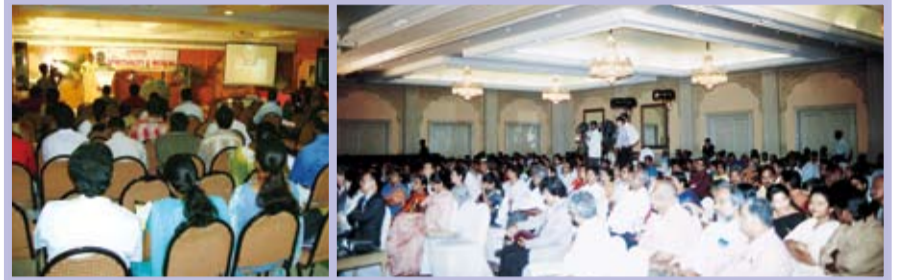
WCDNトゥリチ・セミナー 第2回国際キリスト教医学学会