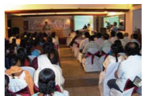
Séminaire WCDN tenu à Trivandrum en Inde

Inde en Mai 2005 près de 500 médecins de 11 pays ont participé et ont fait des présentations en couvrant des cas de guérison par la puissance de Dieu et les ont prouvé médicalement. Depuis lors, le WCDN continue sa mission en Inde en fortifiant l'évangélisation de l'Inde. Des séminaires se sont tenus à Nagercoil et Tiruchirappalli de l'Etat de Tamil Nadu, à Hyderabad de l'Etat d'Andhra Pradesh, Trivandrum et à l'Institut Médical de Karakom de l'Etat de Kerala. De plus, ils tiennent des réunions préparatoires pour des séminaires à New Delhi, la capitale, et ils réveillent de nombreux médecins, des enseignants et d'autres du monde académique par la puissance de Dieu et l'évangile de sanctification.