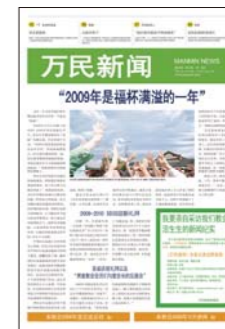
Chinois simplifié (publié hebdomadairement)

Les Nouvelles de Manmin sont très utiles, spécialement dans les pays où ils manquent de la ressource d'une mission établie. Présentement, les Nouvelles de Manmin plantent la foi dans les cœurs de nombreuses personnes et leur faisant connaître le chemin pour recevoir les réponses et les bénédictions.