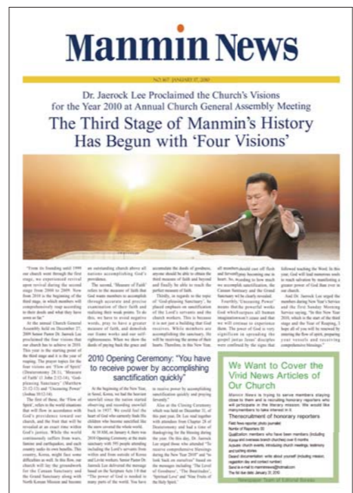
La version anglaise des Nouvelles de Manmin est traduite sur une base hebdomadaire et sert de fer de lance pour la mission mondiale.