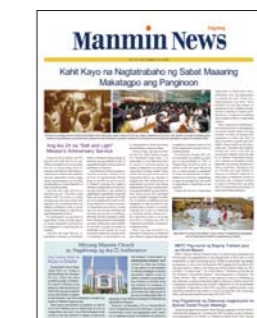
Tagalog des Philippines (bimensuel)