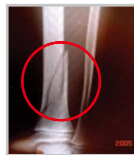
Los brisé en trois parties