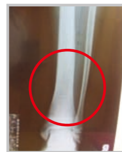
Los reconstruit après la prière