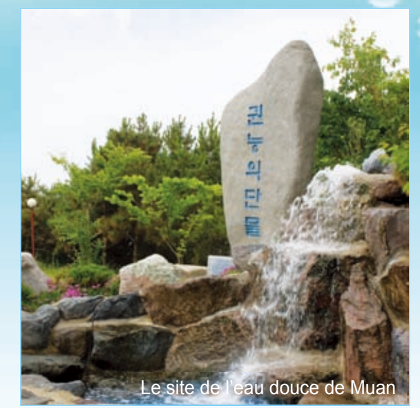
Le site de l'eau douce de Muan

Le test a prouvé que l'eau douce de Muan est bonne