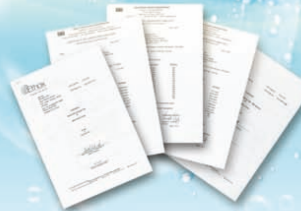
Résultats des tests de la FDA