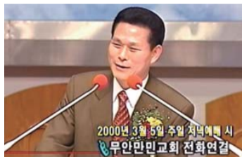
Culte de Dimanche, 5 Mars 2000 Le Pasteur Principal parlait avec le Pasteur Kim au téléphone