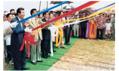
26 Juillet 2000 Cérémonie d'Inauguration du Monument.

Je donne toute reconnaissance et gloire à Dieu qui a béni l'église Manmin de Muan pour devenir l'instrument du Saint-Esprit pour sauver d'innombrables âmes dans la grande providence de Dieu pour la fin des temps.