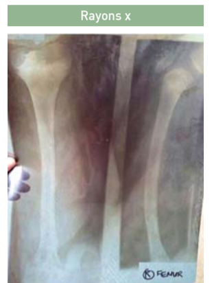
Aucun signe de fracture sur la cuisse droite (droite) ni sur le tibia droit (gauche)

Mon fils détestait écrire des lettres auparavant et j'ai donc vaporisé de l'Eau Douce de Muan sur ses doigts avec foi. Il ne déteste plus écrire!