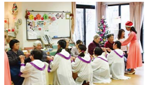
与老人们一起唱颂赞美的舞鹤万民教会圣徒们

12月11日，日本舞鹤万民教会(主任牧师：金建泰)女宣教会和唱诗班、学生部走访了位于舞鹤市的一家老人福利设施——“樱花广场”(专为有障碍或生活无法自理的老人服务的老年人福利中心)传达了主的爱。当唱诗班唱起圣诞颂歌时，老人们呆滞的表情开始变得明亮了，看到身着天使服装的学生部舞蹈队的演出，从四处响起了感动的掌声。接着圣徒们给老人们讲述了有关耶稣的诞生和圣诞的意义，之后又与老人们谈笑风生，而且又奉献了精心准备的礼物。对圣徒们这般温暖的爱心，老人们眼眶湿润了，并纷纷表达了感谢之情。