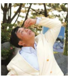
将务安甜水池水滴入眼睛后,左眼的严重闪光得到了医治。

如今,他们满得健康和物质上的祝福,过着幸福的信仰生活。不仅如此,我本人也正在体验着这般的作工,使我在圣工中感受到无穷的乐趣和幸福。