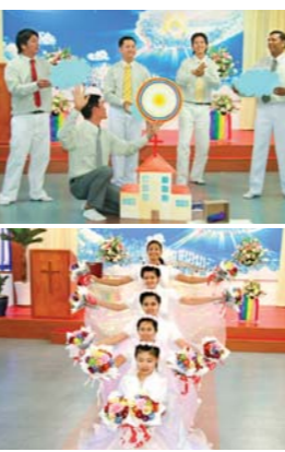
以圣别和特别崇拜于神的檳城万民聋哑人教会圣徒们

如今《万民新闻》译成英语、日语、中国语、西班牙语、俄罗斯语、法语等14种文字发行普及。