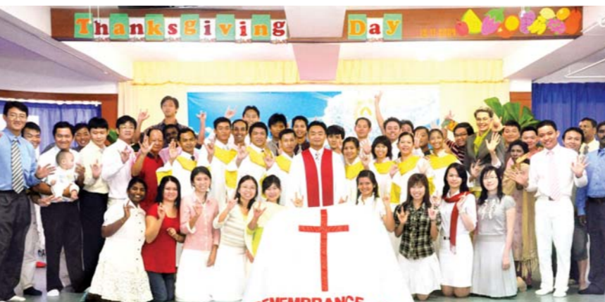
在马来西亚檳城万民聋哑人教会圣徒们齐心协力建立的圣恩里上收获感恩节(2009.11)后,与地政牧师(前排中间)一同合影。