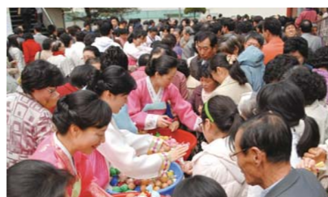
主日大礼拜结束后女宣教会会员们在给圣徒们分发复活节彩蛋。

在迎接受难周和复活主日之际，本教会全体圣徒深深缅怀思念主的大爱，度过了虔诚而意义深远的每一天。