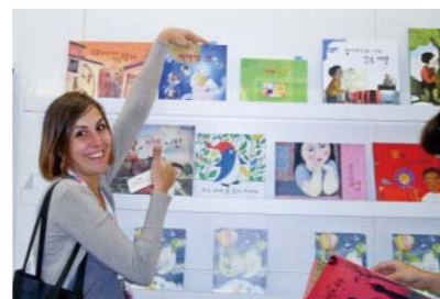
在波伦亚儿童图书展上展出的《漫画中的智慧之泉(1、2)》

3月23日(周二)至3月26日(周五)在意大利波伦亚儿童图书展上展出了李载禄牧师的著作《漫画中的智慧之泉(1、2)》。这本书是将李载禄牧师的信仰专栏集锦《智慧之泉》用漫画改编，为儿童出版的书籍。波伦亚儿童图书展(www.bookfair.bolognafiore.it)每年都在波伦亚展厅举行，是世界最大儿童图书著作权交易专门图书展。