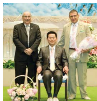
被任命为本教会协力牧师的费尔南多·波尔本驻韩哥斯达黎加大使(右)与堂会长李载禄牧师的纪念合影(左边是哥斯达黎加国会议员盖恩·奥尔特·马塞)

3月28日主日晚礼拜时，在本堂举行了费尔南多·波尔本驻韩哥斯达黎加大使的协力牧师任命仪式。