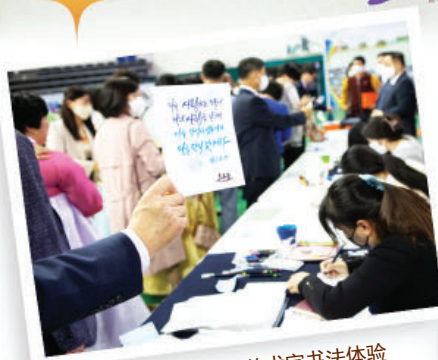
圣徒们警言金句美术字书法体验