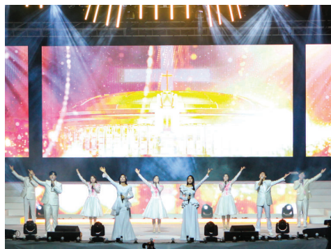
第三场 得胜 (赞美) 向亲领万民事工的神谢恩的赞美