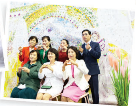
装点美丽的拍照留影亭 人生四段大头贴拍摄点