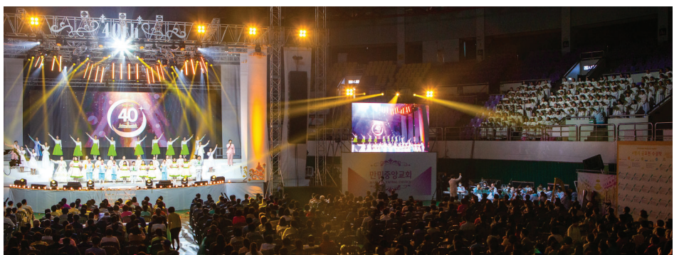
终场 全体演出人员将所有感谢和荣耀归与教会创立四十年来看顾保守的三一真神