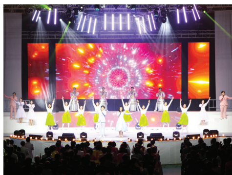
第七场 创立的喜悦 全体圣徒向同在的神献上会众赞美