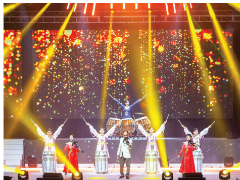
第五场 得胜 (演奏) 感恩如火般圣灵工作彰显不断——鼓/电子弦乐演奏