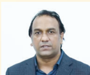
哈伦·伊姆拉尼·吉尔 巴基斯坦旁遮普省国会议员