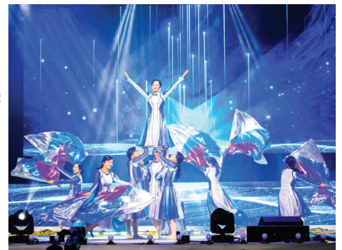
第六场 权能作工 敬献因大权能得荣耀的神——能力舞