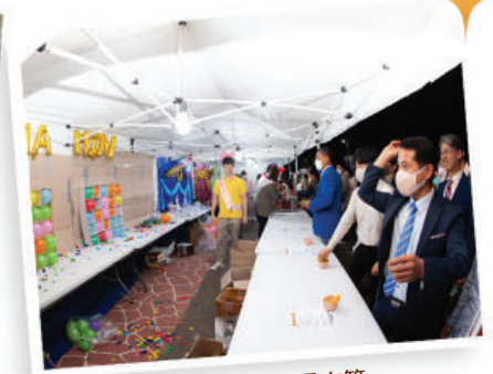
投标、抽奖、寻宝等 各种有奖游戏