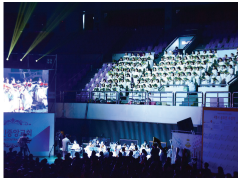
第一场 开幕 创立四十周年之际献与神的充满感动的合唱