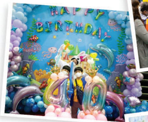
少儿纪念拍照景区 百变气球体验空间——气球艺术