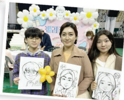
圣徒们幽默夸张的人脸漫画体验