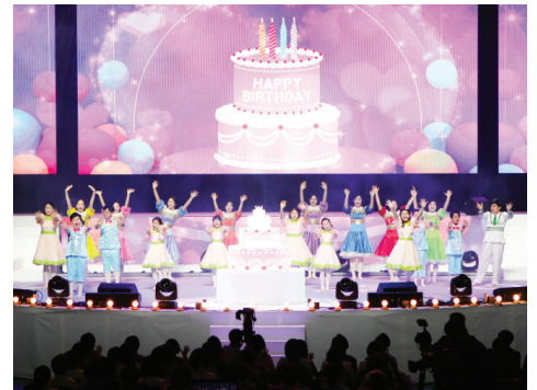
第二场 庆贺创立 大家同心合意庆贺创立四十周年的歌舞