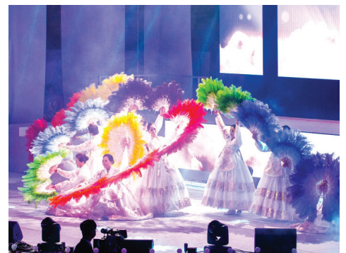
第四场 得胜 (舞蹈) 感恩四十年来蒙赐的真平安——扇子舞