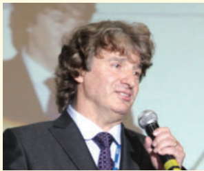
安德烈·卡基洛夫斯基博士 以色列纳粹大屠杀幸存者后援联盟会长