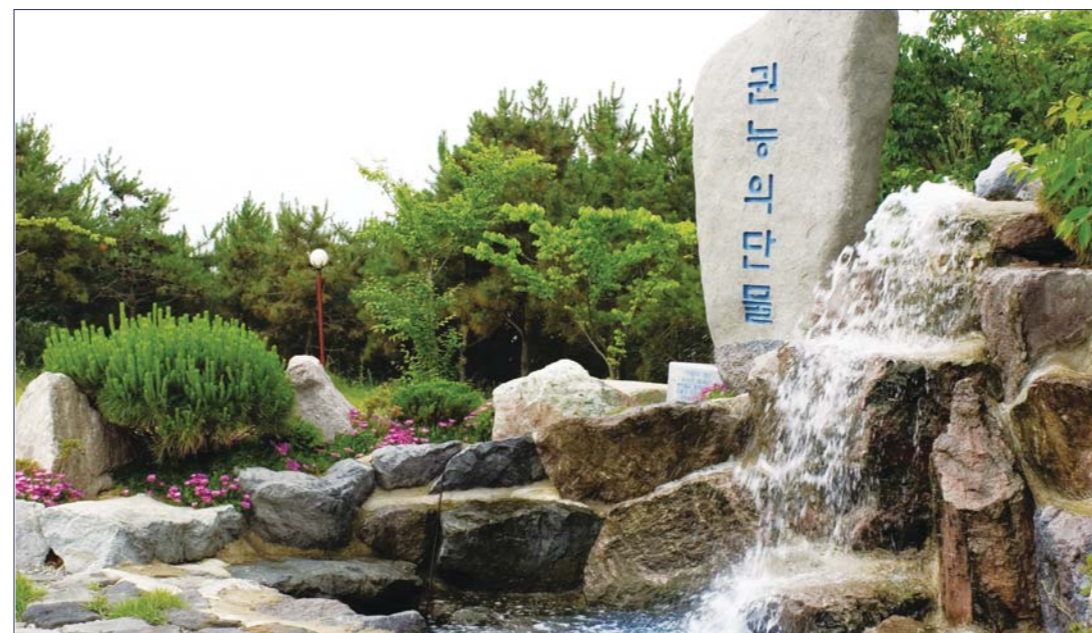
如今也有成千上万的人访问全罗南道务安郡海面泉状里153番地这一务安万民教会前海的咸水变成甜水的权能的现场。

透过务安甜水体验医治作工和诸般权能作工而倍受全世界无数人心仪渴求的权能的务安甜水, 迎来了10周年纪念礼拜及庆祝活动。3月4日, 务安万民教会特邀郑英牧师为讲师献上礼拜之后, 接着举行了务安甜水10周年庆祝演出。