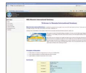
MIS(Manmin International Seminary)网站

MIS神学校分别设立在首尔本部和比利时、英国、俄罗斯、印度、中国、台湾、美国、秘鲁等地。互联网讲座也正在进行，登陆万民国际神学校网站(www.manminseminary.org)注册会员后，填写一