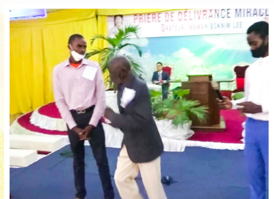
穆太拉(40岁) 关节炎治愈行走自如