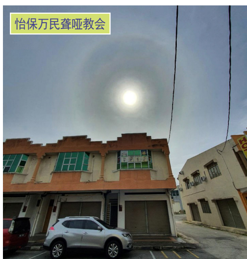
怡保万民聋哑教会

最近马来西亚万民聋哑支教会举行创立纪念礼拜及庆典。马来西亚以外还有二十一个万民聋哑支教会透过多重影像系统同参与活动。