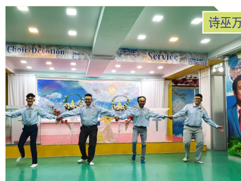
诗巫万民聋哑教会