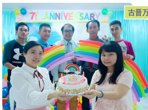
古晋万民聋哑教会

现今有十四个万民聋哑支教会分布在马来西亚、泰国、拉脱维亚、哥伦比亚四国，并且在泰国、中国、丹麦、法国、美国、澳洲等十八个国家设立家庭教会。