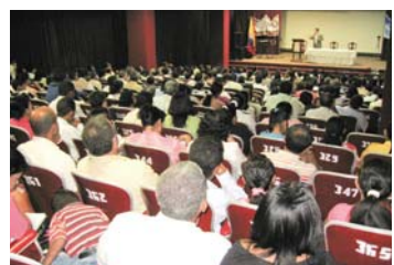
正在引导哥伦比亚的巴兰基亚教会者研习会