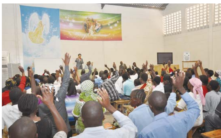
“全体圣徒特别传道大会”期间每周主日大礼拜结束后进行“新教友教育”

“收获之年”的元年——2010年,不仅本教会,连支教会也在争先恐后地忙碌着筹备工作。其中非洲肯尼亚万民圣洁教会(主任牧师:郑明浩)也在为了实现新堂建设的目标,从1月至3月,“全体圣徒传道大会”正在如火如荼地进行当中。圣徒们积极响应的结果是:24日主日礼拜有140名、31日有84名新圣徒登录了教会。内罗毕万民圣洁教会的圣徒们每周六举行以各地区长们带头的祷告会,祷告会一结束,他们与自己所属管区的主的仆人一起组成传道组,挨家