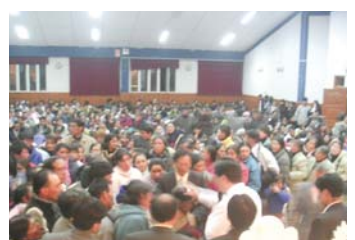
在安第斯中部地区举行的聚会中，为众多患者做手帕祷告

的了解。我拿出“十字架之道”光盘对他做了一番说明：这是非常有价值的节目，只要您先凭信心栽种，不久必会体验从神来的祝福。并提议他在电视节目里中播放24篇“十字架之道”讲道。他欣然答应了我的请求，并在每周主日上午播放一小时。从那以后起观众打来的感谢电话络绎不绝，节目播出前后的广播事工出现了极大反差。