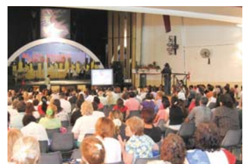
在阿根廷的布宜诺斯艾利斯教会者研习会中放映“权能”录像