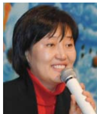
发表祝词的朴英善国会议员

寻找自由,投入大韩民国怀抱的新住民(脱北定居者)群体中,许多人遇见神,步入信仰的大门。其中有不少人正在出席本教会。本教会于2月6日下午3点,在本堂,为了春节不能回乡的他们,举行了慰劳宴,以及主爱宣教会创立6周年纪念礼拜。