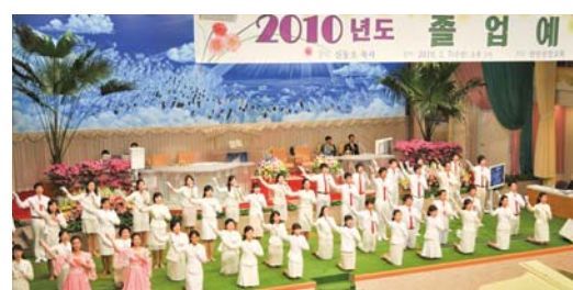
2010年度毕业礼拜代表们献上特颂

2月7日，主日晚礼拜时，在本教会本堂献上了2010年毕业礼拜。今年小学、中学、高中、大学毕业生献身者550名参加毕业礼拜，本堂前排献身者座席无虚席。当日，讲师申冬草牧师以哥林多后书2章14节为主题经文、以“因认识基督而有的香气”（副题：“要显出信主的本色”）为专题见证了神的道。申牧师嘱托献身者们说：“为了显出基督徒的本色，不仅要外表良善，而且要内心良善，以善胜恶，并要脱去图得回报的心，只为神的荣耀而活。”