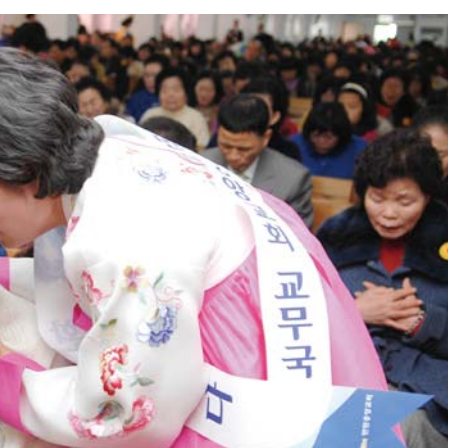
为新教友举办的“圣灵充满祷告会”上,地区长在帮助圣徒们的祷告。

本教会圣徒们常常经历到照着圣经的约言成就的信实的神，从而过着圣灵充满的信仰生活。本教会神学教育课程对此起到举足轻重的作用。其中“五周培训课程”和为系统地装备神道而设立的“万民圣经学校”可谓两大主轴。下面为还未曾体验这两种教育课程的圣徒们，详细介绍培训过程等。