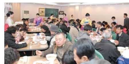
新教友们主日大礼拜结束后,在新教友欢迎室享用午餐。

透过本教育课程，新教友可以学到《圣经》基础知识和教会相关信息，渐渐适应教会这一崭新环境。因为领受圣灵才能成为神的儿女，所以借着祷告会帮助新教友们领受圣灵。