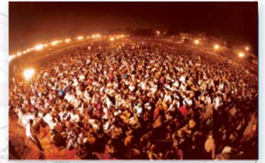
▲ 打开牢不可破的回教圈宣教之门——巴基斯坦联合大盛会（2000年10月）