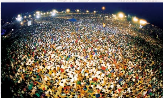
▶ 超三百万人次云集——印度联合大盛会（2002年10月） 藉着创造万有的神之奇妙权能，无数印度教徒得医治病，改信基督，透过印度四家电视台和因特网进行直播。