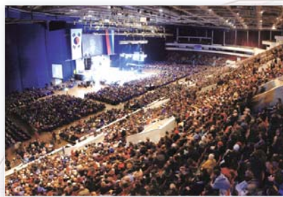
▲ 实况传播至一百五十余国——俄罗斯联合大盛会（2003年11月） 盛会由俄罗斯教会协议会（ACCR）主办，在圣彼得堡奥林匹克体育场（S.K.K）举行，透过涅夫斯基和OTB、TBN俄罗斯电视实况直播，由十二颗卫星和无线和有线电视向全世界一百五十个国家报道。

仿佛用强大的隐形轰炸机攻破属灵上固若金汤的中东“壁垒”一样，神引导我们藉着祂无比强劲的权能在世界各地举行盛会，旨在使福音回归地极以色列——现今的福音“荒地”。