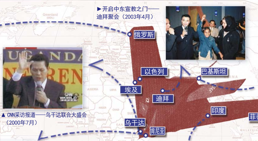
▲ CNN采访报道——乌干达联合大盛会（2000年7月）