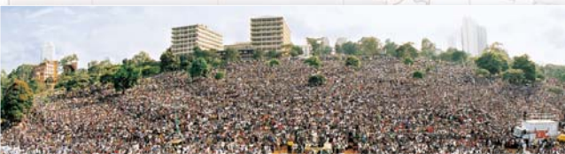
▲ 艾滋病等各种疾病治愈，神迹大显——肯尼亚联合大盛会（2001年6月）