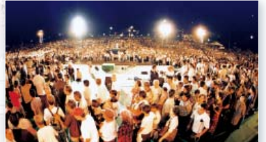
▲ 台风退去等，彰显创造至上的权能——菲律宾联合大盛会（2001年9月）