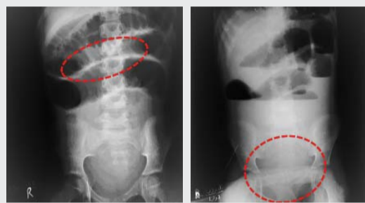
肠道堵塞不通, 呈鱼骨状阴影(左), 左边直肠部位未显空气阴影, 疑似肠梗阻。

体重仅有十一公斤(正常应三十五公斤左右), 因为有手术过程中致亡的危险, 术后也难以期待恢复正常状态, 手术治疗方案也被搁浅。