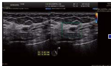
▲ 接受祷告前：左乳正右方可可见到0.41厘米大小肿块。