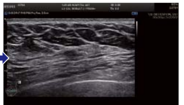
▲ 接受祷告后：左乳正右方不见肿块。