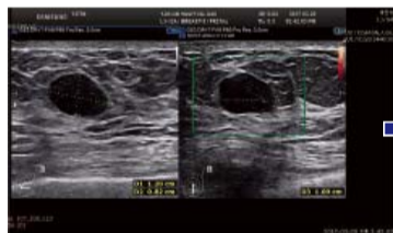
▲ 接受祷告前：左乳正下方可见到1.09厘米大小肿块。