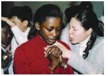
训练生们在“宣教体验之旅”期间为当地圣徒们恳切祷告