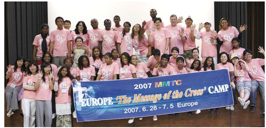
左边是宣教会开创初期没有礼拜

训练生们在被派遣之前，借着“宣教体验之旅”可以确定自己的宣教地和宣教方向。1998年1月以日本、台湾为起点，迄今定期在西亚、中国、欧洲、俄罗斯、东南亚、中南半岛等地举办“宣教体验之旅”。这项活动往往延伸到宣教地开拓、宣教士派遣，因此“宣教体验之旅”同时具有Field Operation(受派前实地考察；宣教士派遣到宣教地之前，调查当地的宗教、文化、经济、社会状况，以做好宣教准备。)的性质。