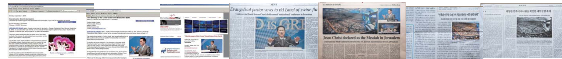
世界首屈一指的通讯社和国内外各大基督教媒体报道了“2009以色列联合盛会”