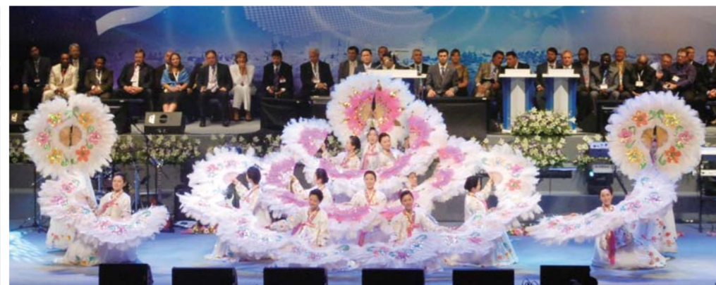
伴着一曲“金色的耶路撒冷”万民中央教会宣教团表演扇子舞