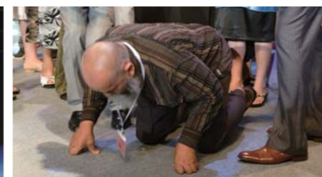
19年以来第一次能屈膝的见证者