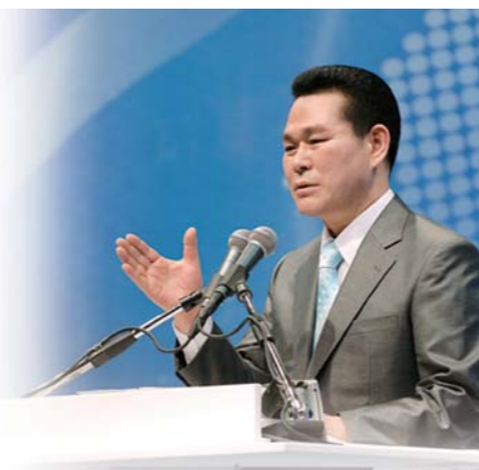
出售李载禄牧师共26种多国语言译本著作的展位

以色列是主耶稣诞生之国，是神的选民。然而他们却不知道耶稣基督是救主，到如今仍然在苦苦等待着救主的出现，为了使他们沉睡的灵苏醒，万民中央教会会长李载禄牧师和宣教队一行来到了以色列。高水准的基督教文艺演出，听着生命的话语欢呼的观众，得到医治走到台上作见证的人们，报道盛会消息的舆论媒体等，给大家介绍由李载禄牧师引导的“2009以色列联合盛会”方方面面。