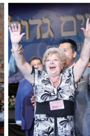
颈部痛得到医治后兴奋不已的见证者