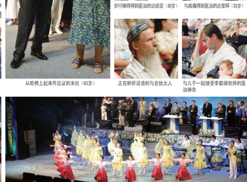
用英语、法语、俄语、希伯来语、林加拉语等五个国家语言赞美神的宣教队