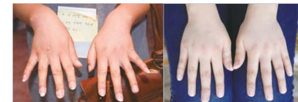
惠临瘰子得医治的手 [接受祷告前(左)、接受祷告后(右)]

回想往日，心里总有没能好好照顾丈夫的亏欠感，丈夫也好像因为当初没能认出这么好的教会逼迫我的事情打心眼里内疚。一切感谢与荣耀都归于以确实的体验和无微不至的爱引导我们家庭踏上信心之路的父神。