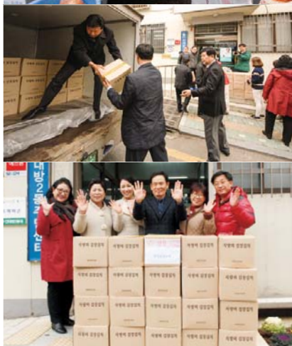
本教会女宣教会会员们以爱和真诚腌制越冬泡菜，包括本教会救济家庭，通过附近多个机关团体分发给一千三百余户困难家庭，为他们送去主的爱。

2015年11月18日19日两天，“第十八届爱心越冬泡菜分享”活动在本教会后院由女宣教会总联合会组织举行。活动所用的白菜是全罗南道海南的一位圣徒自家种植。她经历了造物主神的权能作工治愈孙子的烫伤后，为报答主恩，每年奉献数千颗大白菜。负责搬运和腌制白菜的教会职员们清晨一大早购买各种腌制泡菜的配菜调料，一颗颗白菜浸满女宣教会会员的爱，本教会独特的美味越冬泡菜就这样成了。