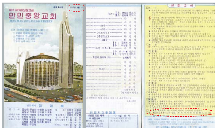
“6.29”预言刊登在1987年6月21日万民中央教会周报封面和扉页

李载禄牧师之所以这样不断预言，目的就是向全世界众多灵魂见证永生的真神，给众圣徒们栽种信心，建立德行，复兴教会，扩张神国。