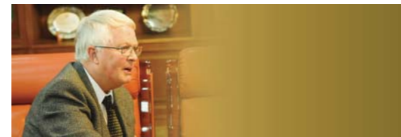
甸·优丁记者 (ANS: ASSIST News Service 代表)

万民中央教会凭借神迹、奇事，面向全世界竭尽全力地传播耶稣基督的福音。公演也非常精彩，并深深体验了神同在的确据。尼西管弦乐队和大规模的唱诗班融合在一起的赞美和舞蹈独具特色。在世界任何一间教会都无法欣赏到这样高水准的演出。