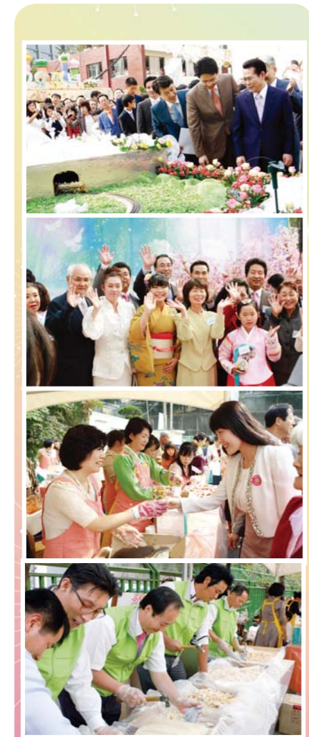
创立29周年纪念主日露天活动场所 哈哈!呵呵!纪念照留念,享受各种美食,因着圣徒们的爱心和服侍,增添了创立的喜悦气氛。

Manmin Central Church website: www.manmin.org Tel: 82-2-818-7060 Fax: 82-2-818-7048 E-mail: manminchina@gmail.com