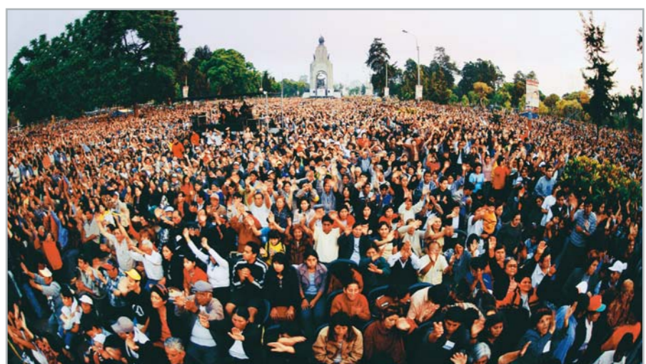
秘鲁，因着靠圣灵的权能宣告的圣洁福音，开始了新的历史。盛会聚集人数达到了50万，包括艾滋病(AIDS)在内的各种疾病得到医治的见证场面，直播到整个中南美大陆，广传了基督的大爱。