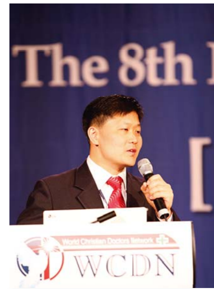
“WCDN (World Christian Doctors Network) 是全球性的基督徒医生宣教团体，旨在根据医学资料分析神的医治事例，确证神的永能和圣经的真实性。”