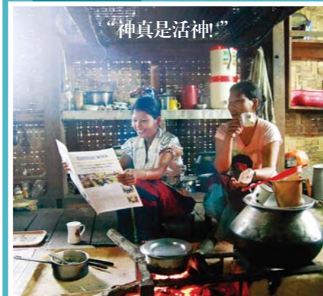
印度阿鲁纳恰尔邦穷乡僻壤的火田民(以开垦林地为生的人)一家在阅读获赠的《万民新闻》，欢欣喜悦。《万民新闻》包括韩语、以英语、汉语、俄语等20多种文字发刊普及。