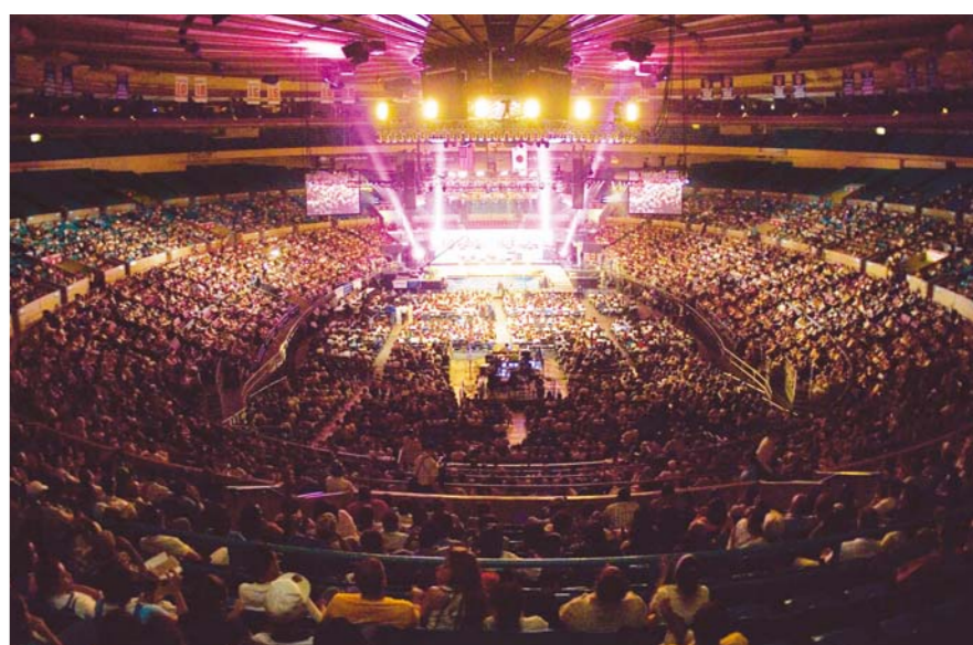
“2006特邀李载禄牧师纽约联合大盛会”以悔改和医治的大能，使麦迪逊花园广场成为了奇迹现场。此次盛会通过卫星和无线、有线电视，向全世界约200个国家实施了现场直播。

亲爱的各位圣徒：希望圣徒们通过话语查验自己是否也有主责备以弗所教会的部分，如果发现自己失去了起初的爱心，就要及时回想从哪里坠落的，并悔改归正，从此认真度过信仰生活。奉主圣名祝愿大家，认真遵行神的教导，恐惧战兢作成得救的工夫，而且还要超越起初的爱心，一天比一天更加火热爱神，从而得享神所喜悦的幸福人生！