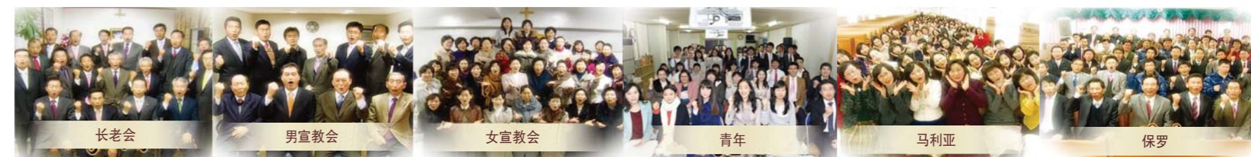
大学宣教会立志成为不与世界妥协的真正的基督徒，开展了“进入新耶路撒冷运动”。紧接着长老会、男女宣教会、青年、马利亚、保罗、迦南宣教会也热心参与了此次活动。(照片最上方是大学、迦南宣教会)

喜迎圣诞节，为感谢耶稣的诞生，以及报答我们更深体会主慈爱，把天国盼望铭刻在心的牧者恩典，全体圣徒开展了“灵性复兴”运动。